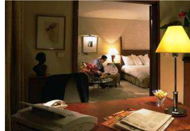
Suite Regency King