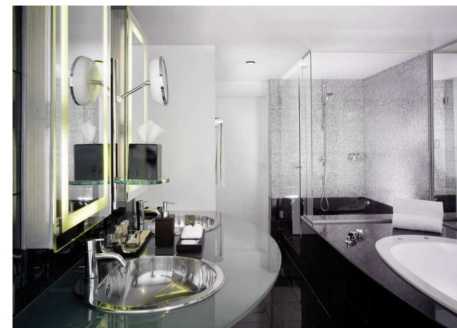
Salle de bain Suite Présidentielle