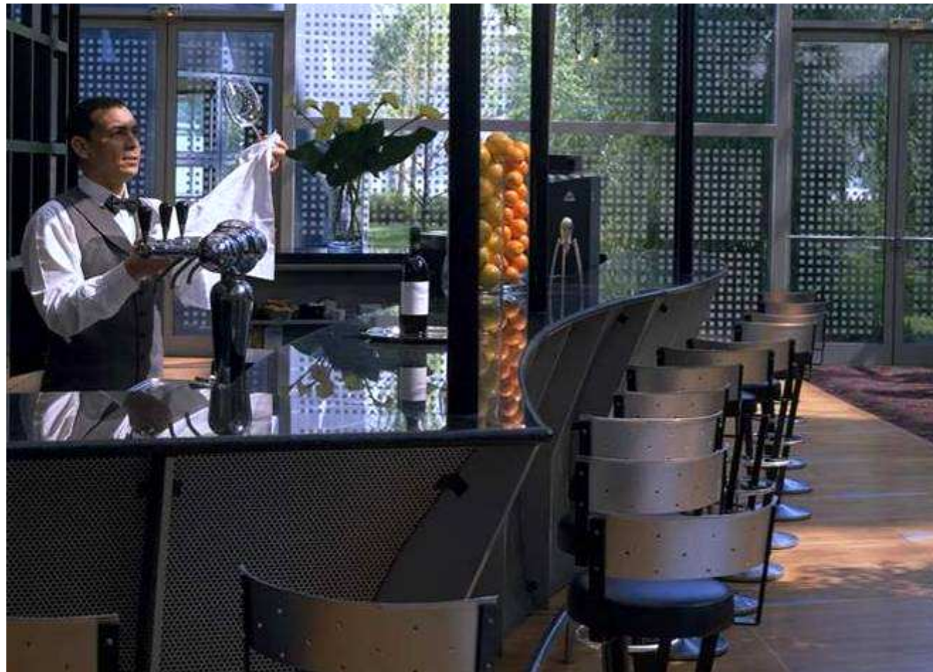
Le Bar Cosmos