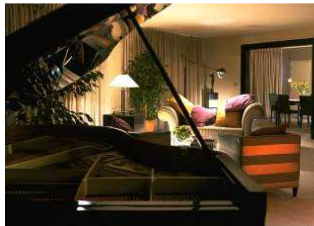
Salon Suite Présidentielle